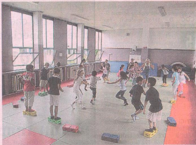
Scuola ed educazione motoria: un rapporto sempre complicato

il tema dell'obbligo di trasmettere in chiaro alcuni eventi sportivi. Ora riguarda Giro, Formula 1, Olimpiadi, Nazionale di calcio... Il testo vuole cambiare, «eliminando dalla lista i riferimenti alla partecipazione di squadre italiane e della squadra nazionale italiana». Ma l'«estendere» il numero degli eventi come va d'accordo con la parola «eliminare»? Poi la scuola: due ore di formazione motoria e cultura sportiva per tutti gli studenti. Per le elementari è ancora un miraggio. Nella legge c'è «l'istituzione della figura dell'educatore motorio-sportivo». Farà lui la «formazione»? E i prof di educazione fisica? Finora non ne sono stati assunti nella